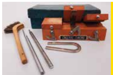
Outils et colleuse 9,5mm Lapierre Cinéma France, 1930 environ CI 425