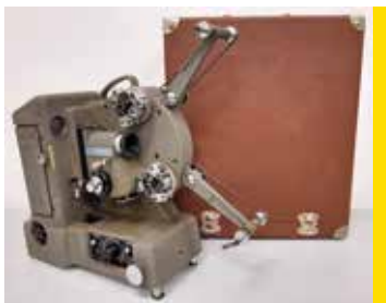
Projecteur 8/9,5/16mm Heurtier Trifilm France, 1958 CI 42