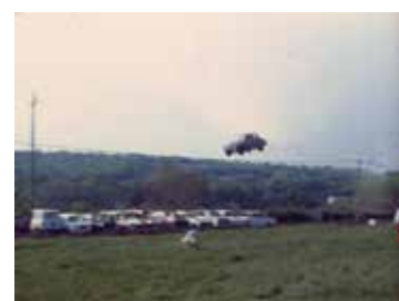
Cascades automobiles Spectacle Sunny à Chavin Jean-Eugène Planque 1982, muet, coul. 00:01:13