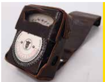
Posemètre LMT 3004-B France, 1950 environ CI 446