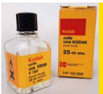
Colle Kodak France 1955 environ CI 426