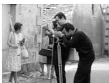
Création CICLIC Marie Dupont Bobine 8 Ciclic Pôle Patrimoine 2019, sonore, NB&coul. 00:03:26