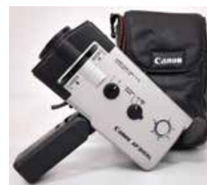
Caméra Super8 Canon AF 310 XL Japon, 1982 CI 335