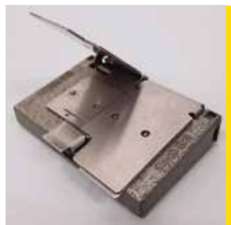
Colleuse 8/16mm Muray France, 1960 environ CI 447