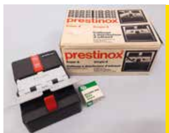
Colleuse 8mm/Super8 Prestinox France, 1978 CI 449