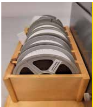
9 films d'édition utilisables sur la visionneuse CI 411