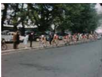
Course cycliste Paris-Tours à Amboise Robert Ernie 1961, muet, coul. 00:01:17