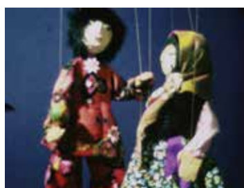
De l'art Marionnettes d'Annie Philippe Sevestre 1975 env., muet, coul. 00:00:40