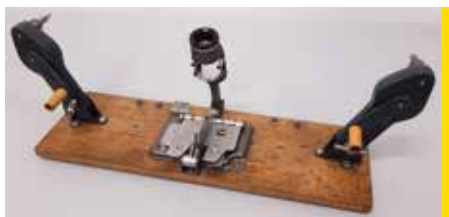
Visionneuse 8mm Marguet France, 1960 environ CI 349