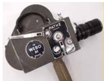
Caméra 16mm Pathé Webo M France, 1946 CI 48