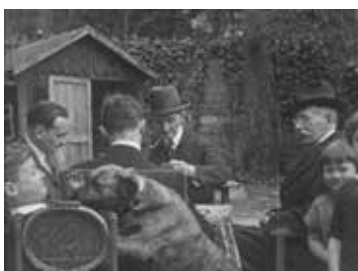
Film de famille En Famille au jardin Charles Le Touz 1930 env., muet, NB 00:01:39