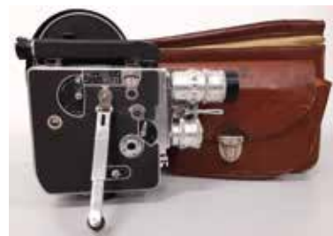
Caméra 16mm Bolex Paillard H16 Suisse, 1935 CI 345