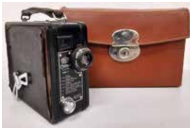
Caméra 9,5mm Coronet Modèle B Angleterre, 1932 CI 313