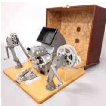
Visionneuse 16mm Muray France, 1960 environ CI 411