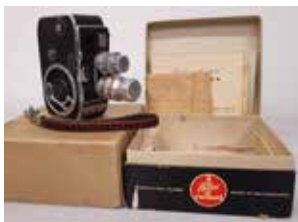
Caméra 8mm Bolex Paillard B8 Suisse, 1953 CI 158