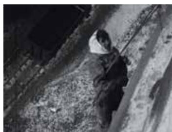
Insolite Un château d'eau Charles Cotelle 1945 env., muet, NB 00:01:01