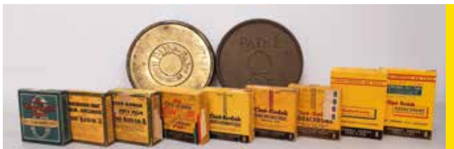
Emballages de films