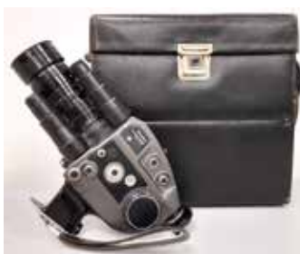
Caméra Super8 Beaulieu 4008 ZM II France, 1971 CI 189