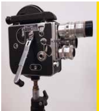
Trépied pour la caméra CI 345