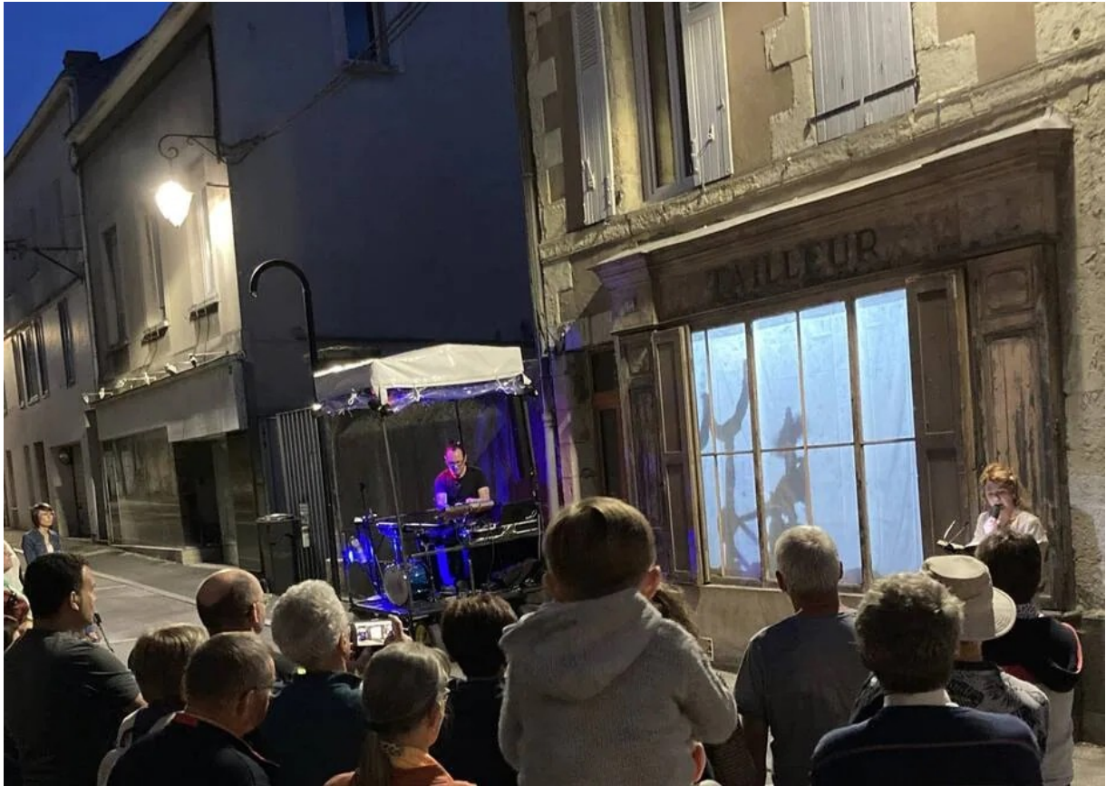
Un des « Arrêts sur Images » devant Le Tailleur, une ancienne échoppe de Chemillé.